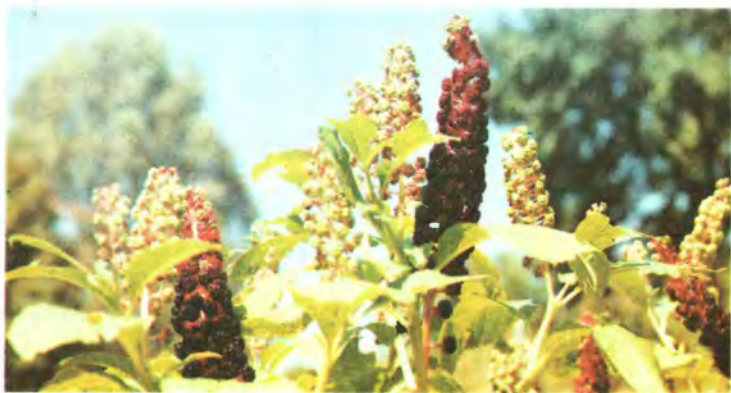
787. Лаконос американський.